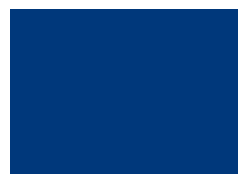
RAL 5002 Ultramarínová