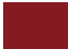
RAL 3003 Rubínová