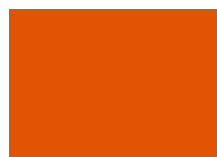
RAL 2004 Oranžová pravá