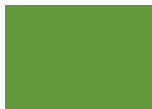
RAL 6018 Zelenožlutá